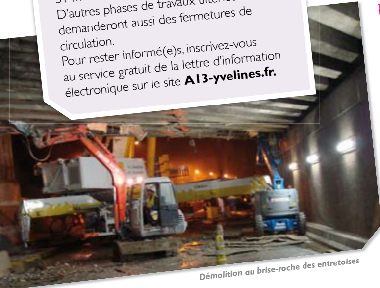
Démolition au brise-roche des entretoises

Une berlinoise similaire doit être mise en œuvre du côté RD 307