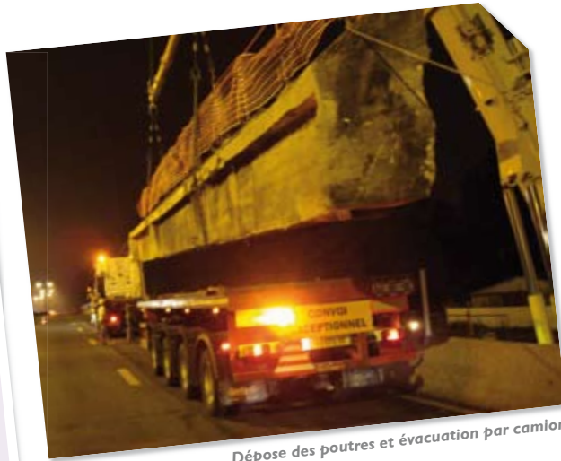
Dépose des poutres et évacuation par camion

D'autres phases de travaux ultérieures demanderont aussi des fermetures de circulation. Pour rester informé(e)s, inscrivez-vous au service gratuit de la lettre d'information électronique sur le site A13-yvelines.fr .