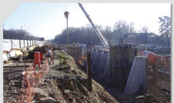
Les travaux côté sud donnent une idée des emprises nécessaires et des techniques employées.

Une protection de chantier sera posée le long de l'autoroute qui va atténuer l'impact visuel de la circulation vis-à-vis des riverains. Les travaux de terrassement, la pose d'une Berlinoise, le forage des pieux et la construction du mur de soutènement se feront à l'exemple de ce qui se passe actuellement côté sud. Les opérations dureront nécessairement plus longtemps, car la longueur à traiter est double et l'espace réservé au chantier plus contraint.